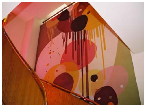
Icon Tada (détail) - Kenzo