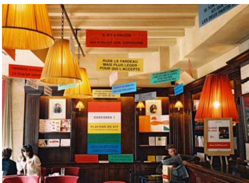
Paul Cox - café Les Editeurs