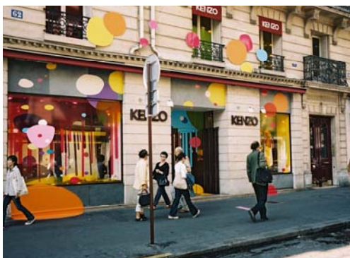
Icon Tada - Kenzo