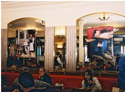
Erwin Wurm - Café de Flore