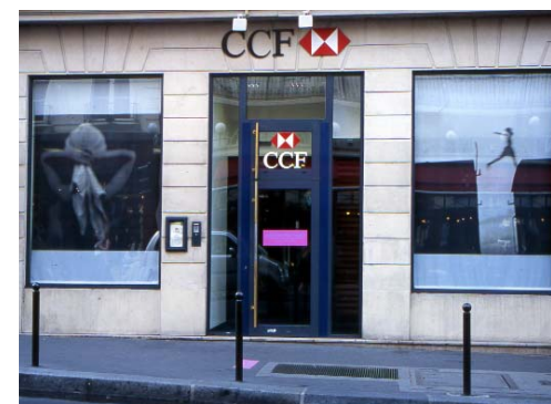
Leblanc & Bernard-Reymond - CCF