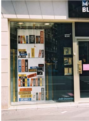
Joël Duccoroy - Montblanc