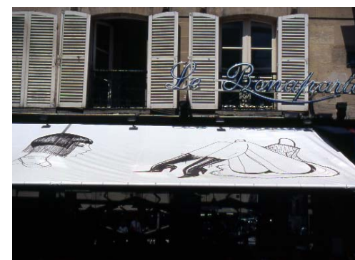
Emmanuelle Mafille - café Le Bonaparte