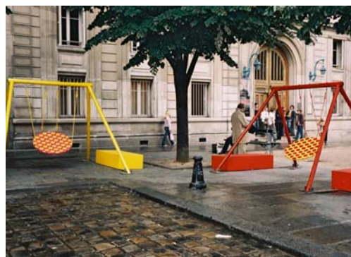
Sophie Larger - point info place St-Germain