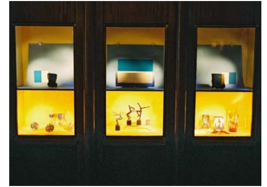
Hugues Decointet - Arthus Bertrand