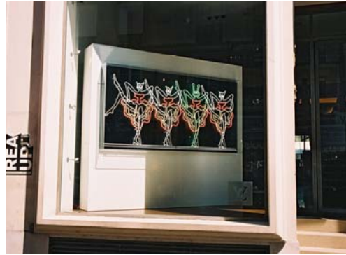
Alain Séchas - Louis Vuitton