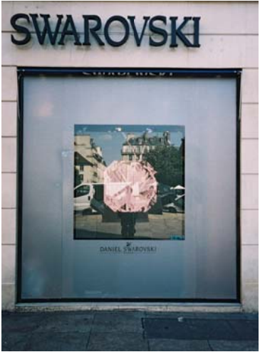
EEM - Swarovski