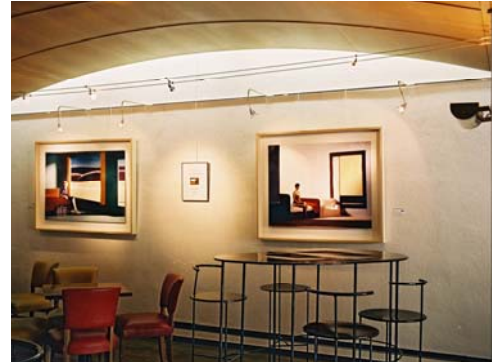
Clark & Pougnaud - T. Vieux Colombier