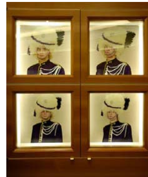
Charles Fréger - Les Montres Rolex