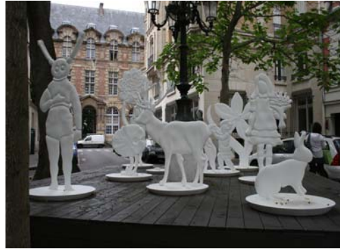
Fabrice Langlade - place Furstenberg