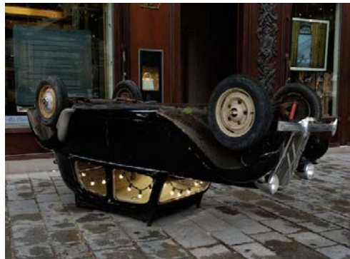
Claude Lévêque - Louis Vuitton