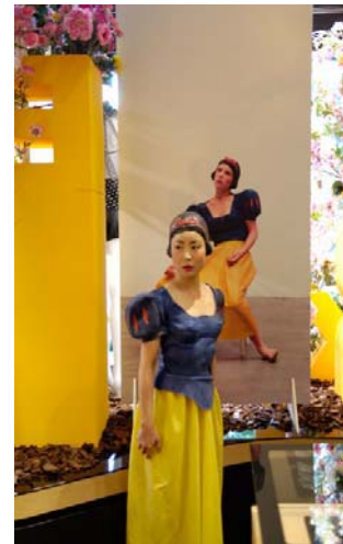
Catherine Baÿ - Sonia Rykiel (performance)