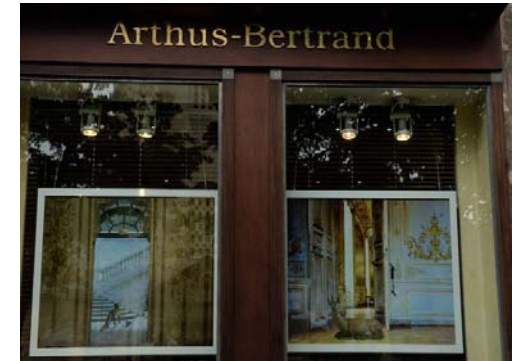
Karen Knorr - Arthus Bertrand