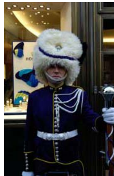
Charles Fréger performance