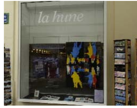
Gérard Fromanger - La Hune