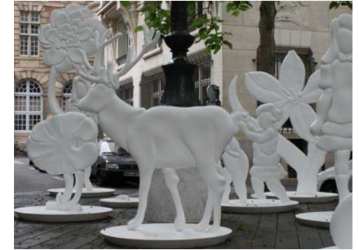
Fabrice Langlade - place Furstenberg