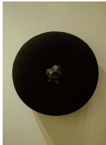
Vincent Beaurin - Céline