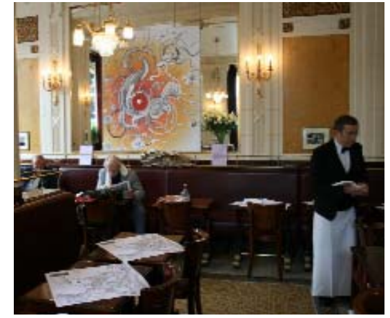
Lotie - Café Les Deux Magots