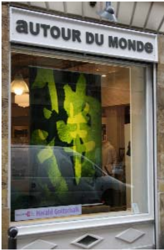
Harald Gottchalk - Autour du monde (Bensimon)