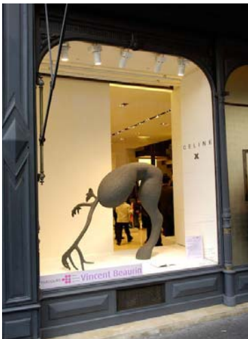
Vincent Beaurin - Céline