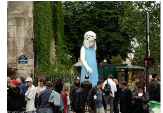
Le Collectif 6bis - place Saint-Germain