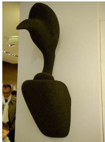
Vincent Beaurin - Céline