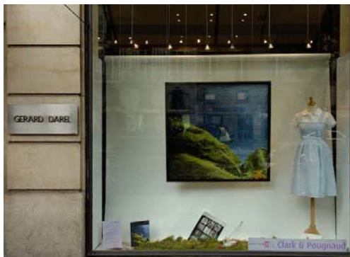
Gérard Darel