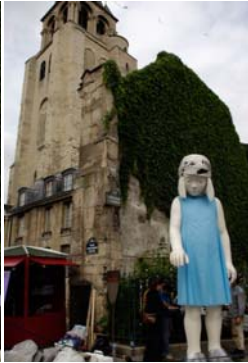
Le Collectif 6bis - place Saint-Germain