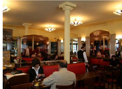
Nicole Tran Ba Vang au Café de Flore