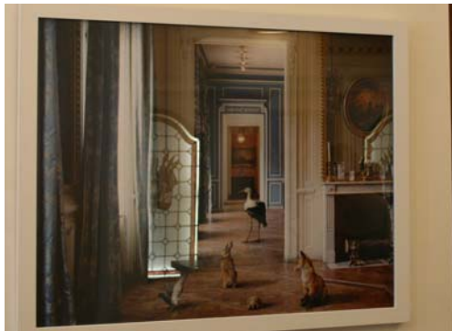
Karen Knorr - Arthus Bertrand