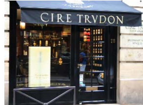
Artus de Lavilléon - Cire Trudon