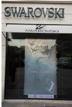
Mijn Schatje - Swarovski