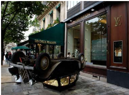
Claude Lévêque - Louis Vuitton