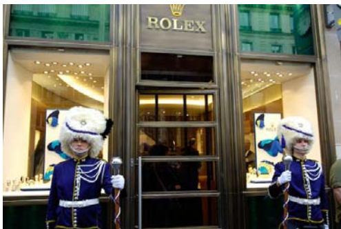
Charles Fréger - Les Montres Rolex