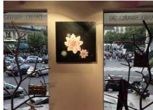
Mijn Schatje - Swarovski