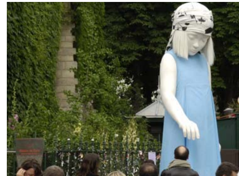
Le Collectif 6bis - place Saint-Germain