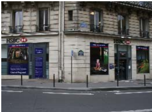
Clark & Pougnaud - HSBC