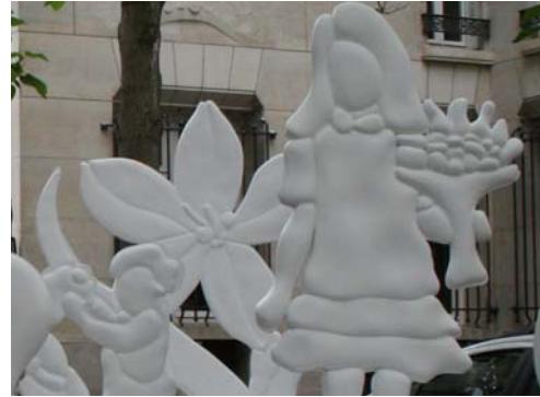
Fabrice Langlade - place Furstenberg