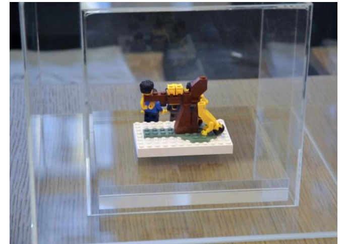
The Little Artists Zadig et Voltaire