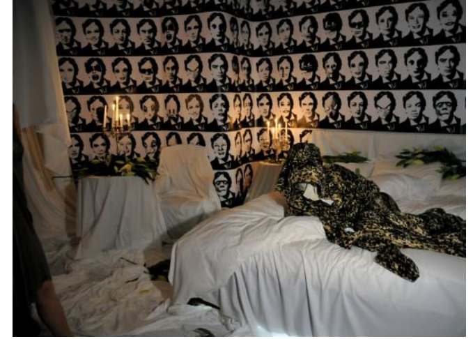
Jean-Charles de Castelbajac L'Hôtel