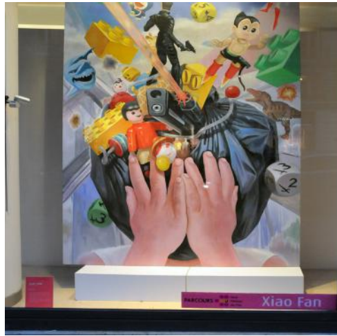
Xiao Fan Monoprix