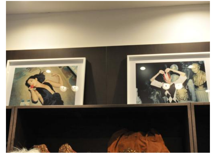
Arnaud Pyvka Antik Batik