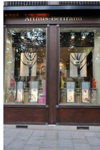
Tadashi Kawamata Arthus-Bertrand