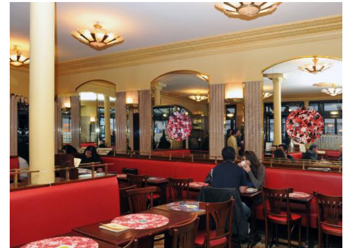
Guy Limone Café de Flore