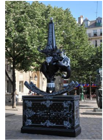
Nicolas Buffe Place Saint-Germain