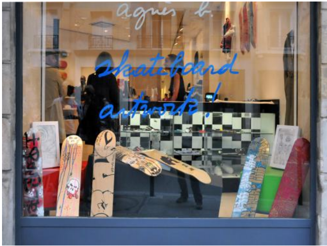
Skateboard artwork ! agnès b.