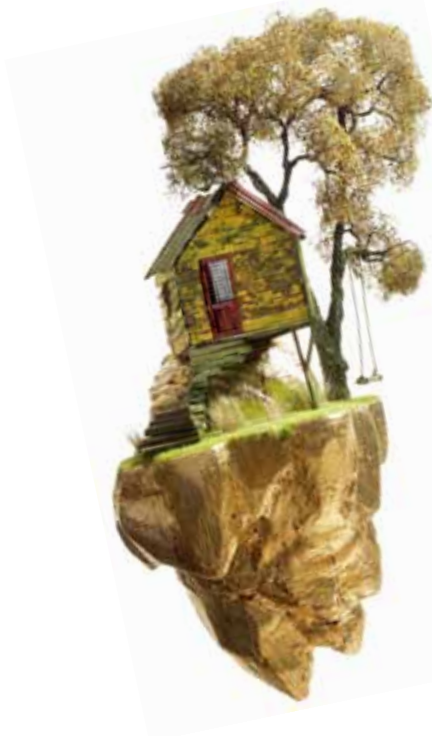
King of the hill, 2008, Matériaux divers, 44 x 34 x 24 cm