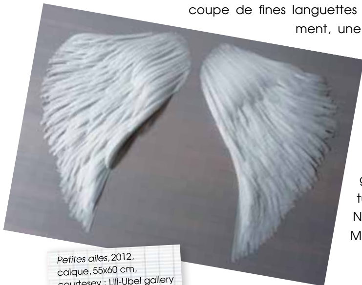
Petites ailes, 2012, calque, 55x60 cm