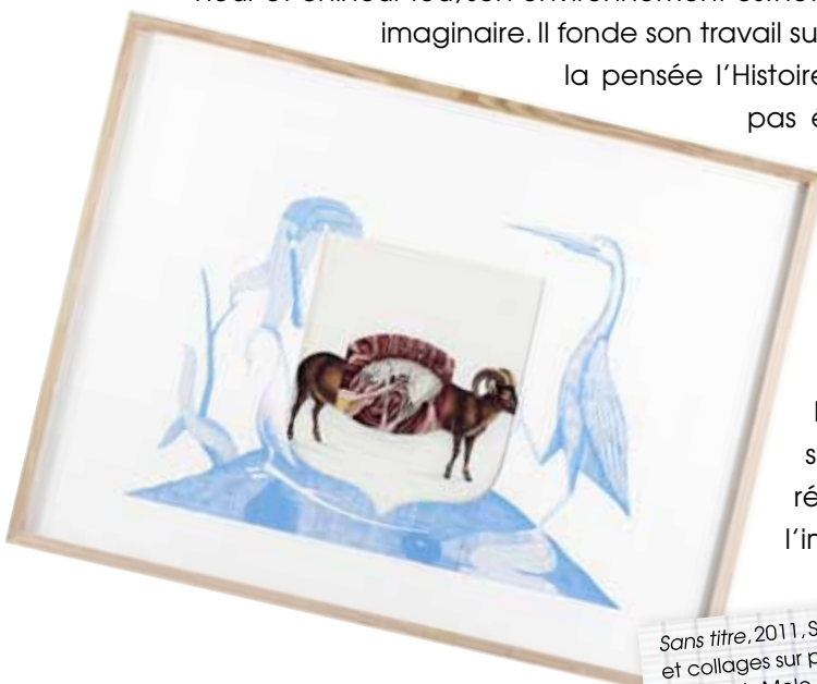
Sans titre, 2011, Sérigraphie, crayons de couleur et collages sur papier 56 x 75 cm, pièce unique.