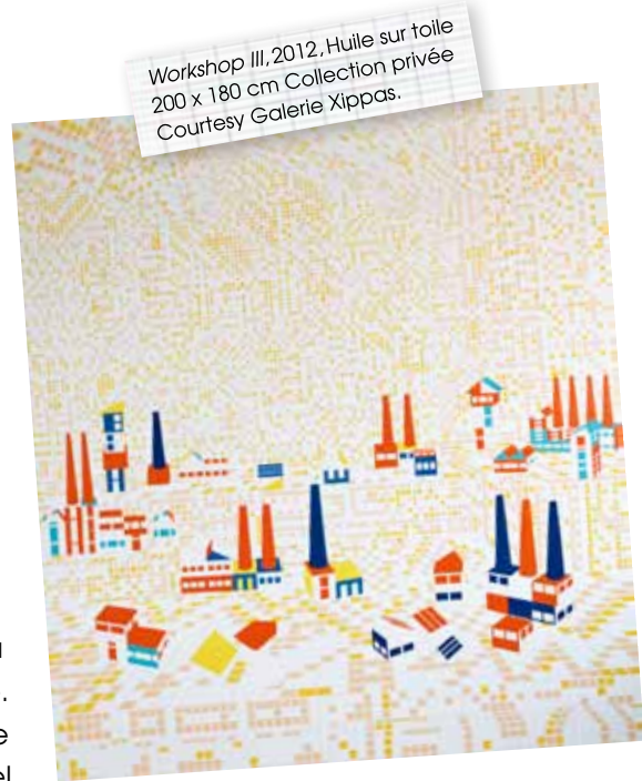
Workshop III, 2012, Huile sur toile 200 x 180 cm Collection privée Courtesy Galerie Xippas.

Depuis 2007, Farah Atassi peint des intérieurs, le plus souvent des espaces collectifs, qui renvoient au monde industriel des années 1930 jusqu'au début des années 1970. Ses intérieurs vides sont comme habités par des objets dont le statut est équivoque, entre référence artistique et évocation de la vie ouvrière. Ici ce sont des installations, là de simples entassements, ailleurs encore des instruments de travail abandonnés. Ses tableaux font souvent référence à des formes et à des motifs modernistes. Le monde industriel ainsi que l'histoire de l'art l'ont amenée à s'interroger sur ce « modèle » moderniste. Qu'il soit célébré ou désenchanté, il révèle toujours quelque chose de l'idéal industriel européen. A travers ses recherches sur les carreaux et les lignes de perspectives marquées, Farah Atassi tend à figurer le plus efficacement possible, à la manière des artistes constructivistes et avant-gardistes.