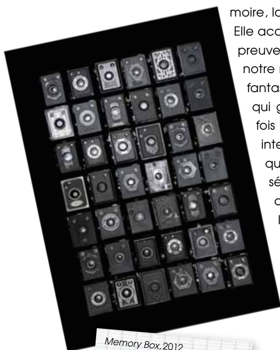
Memory Box, 2012, photographie d'une installation montée sur bois, 196 x 258 cm