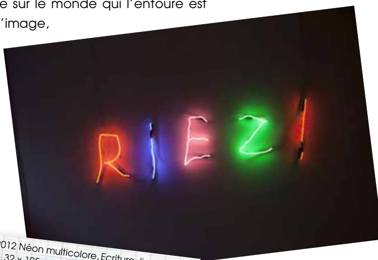
Riez! , 2012 Néon multicolore, Ecriture Jiaxuan Huang, 32 x 105 cm. © ADAGP Claude Levêque.

du son et de la lumière. Ses créations, véritables parcours initiatiques, proposent au public de découvrir le réel sous un angle subjectif et nouveau. « Mes installations ne sont pas faites pour être regardées, mais vécues ».