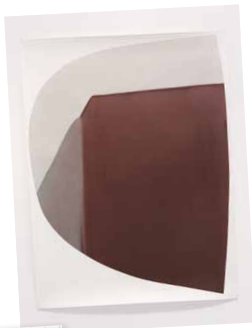
CXVIII, 2011, encre sur papier, 150 x114 cm. Collection privée agnès b., Paris.