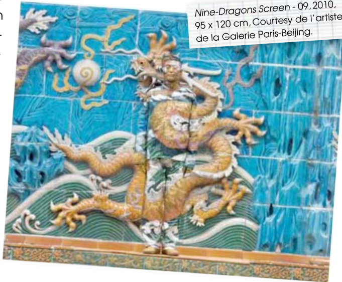
Nine- Dragons Screen - 09, 2010, 95 x 120 cm

Liu Bolin, artiste contestataire, est une référence artistique en Chine et à l'international. Parallèlement à son travail de sculpteur, il développe sa première série photographique en 2005, lors de la destruction par les autorités d'un village d'artistes où se trouvait son atelier. Profondément marqué par cette injustice, il prend conscience de la fragilité de l'individu face au système. L'artiste utilise son corps comme moyen d'expression ; photographe performeur, il se fond dans son environnement, tel un animal. Cet acte d'évaporation génère un rapport tragique et conflictuel entre le sujet et son environnement. Son travail est une profonde et sensible réflexion sur la condition humaine. «Je ne voulais pas me fondre dans le paysage, mais au contraire, c'est l'environnement qui m'a envahi», explique-t-il.