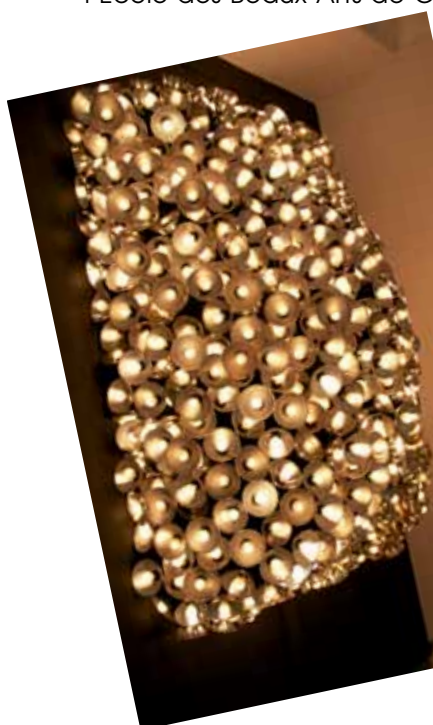
Sans titre, Edition 1/3, 2011 Aluminium, ampoules électriques et variateurs, 96x82x41 cm.