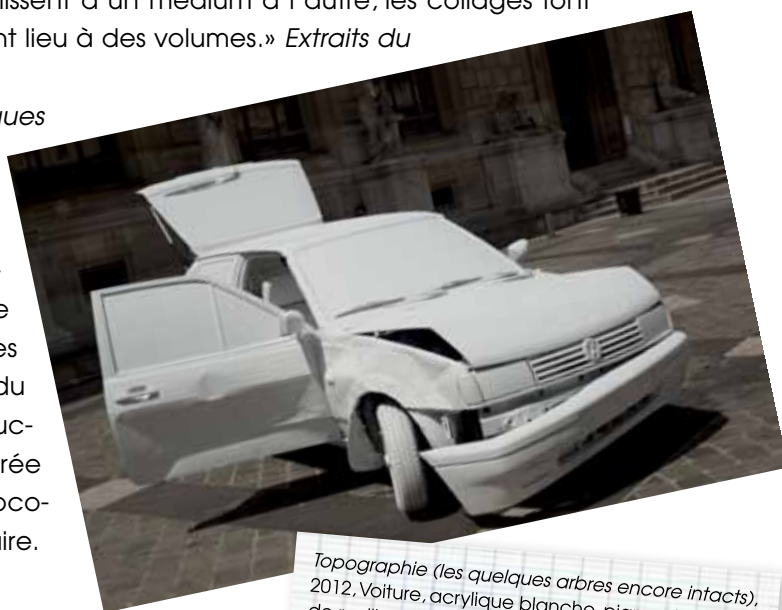
Topographie (les quelques arbres encore intacts), 2012, Voiture, acrylique blanche, pigment de rouille, photocopies, 300 x 160 x 150 cm.

L'installation Topographie (les quelques arbres encore intacts) fait référence au fait que la voiture a changé notre façon de regarder le paysage. Ici, le spectateur est invité à marquer un arrêt et à mettre la sculpture en perspective avec les arbres qui l'entourent. A l'intérieur du coffre, on découvre des reproductions de l'image d'une forêt éclairée par des phares de voiture photocopiée de la plus foncée à la plus claire.