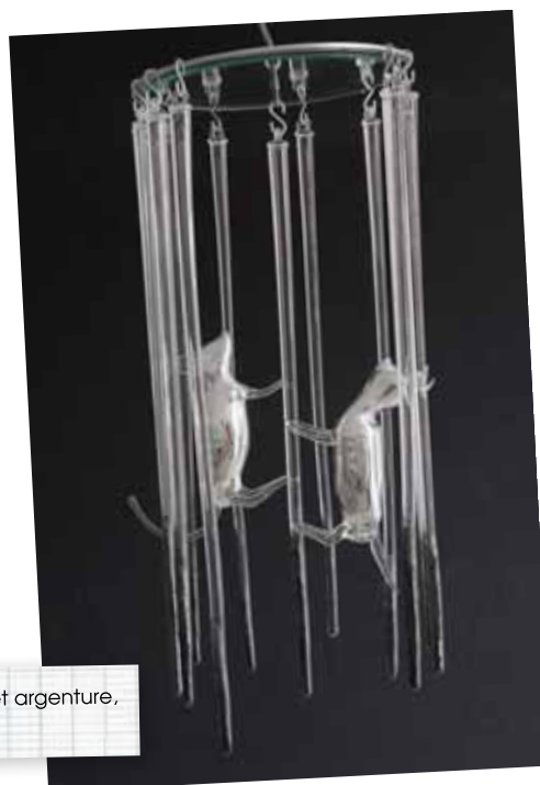
Cage, 2011, verre soufflé et argenture, pièce unique