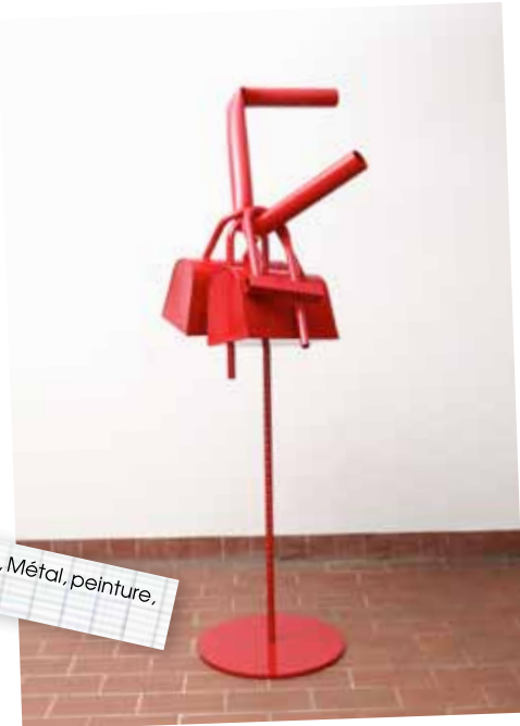
"Sans titre", 2012, Métal, peinture, 163 x 40 x 40 cm.

L'artiste suisse David Renggli utilise des éléments du quotidien de façon décontextualisés et dénaturés. Jouant sur la perspective et la perception des dimensions, il les met en scène dans le but de créer des compositions sculpturales, des mondes surréalistes et post-industriels. Habitée par la question du double et du détournement, son travail érige l'absurde et l'arbitraire comme règle de création. Fondamentalement subversive, elle reste réfractaire aux lois de la logique et du bon sens. Témoin d'une réalité qui nous serait devenue étrangère, l'œuvre joue la comédie et feint la naïveté, pour mieux inquiéter le regard.