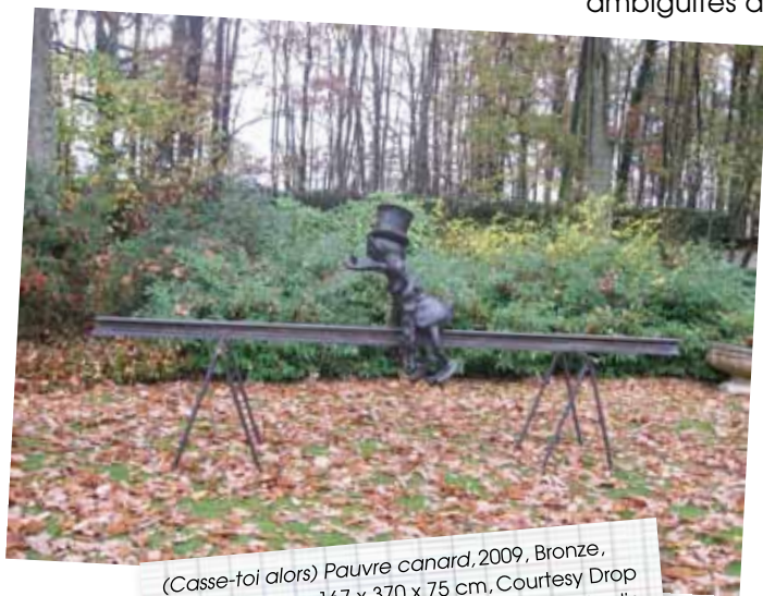
(Casse-toi alors) Pauvre canard, 2009, Bronze, plumes, bitume 167 x 370 x 75 cm

En mêlant poésie et engagement social, l'œuvre de Sven't Jolle (Anvers - 1966) résulte d'une prise de position nécessaire face aux événements socio-économiques et aborde les ambiguïtés du monde occidental et du libéralisme.